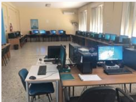
LABORATORIO DI INFORMATICA E DI LINGUE