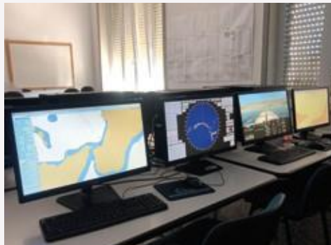
Laboratorio di LOGISTICA