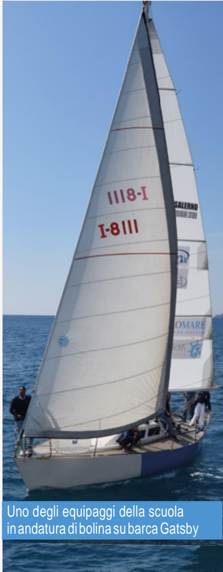
Uno degli equipaggi della scuola in andatura di bolina su barca Gatsby