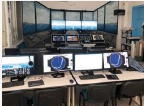
Simulatore di manovra e governo della nave