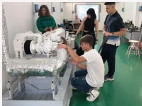
Laboratorio di meccanica e macchine